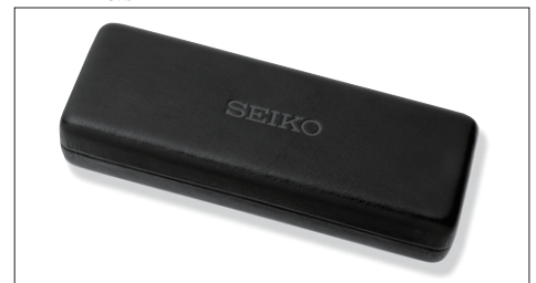
■ Pシリーズ専用ハードケース